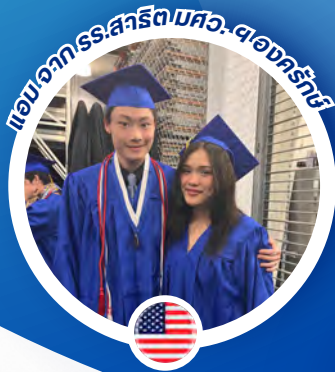
แอนจาก รร. สิริรัตรมหิว. ของครุฑวิฑู