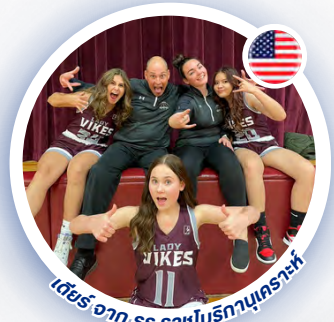
เดียร์จากรร. ราชินีรัตนนครราช