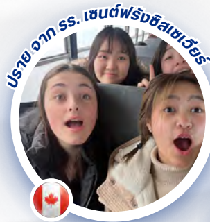
ปราวจากรร. เซนต์ฟรังซิสเซเวียร์