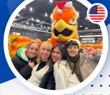
พี้นี่จากรร. หอวัง