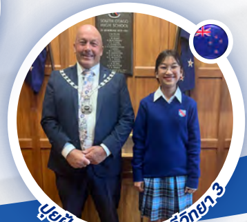
บูญนี่จากรร. สตรีวิทยา.3