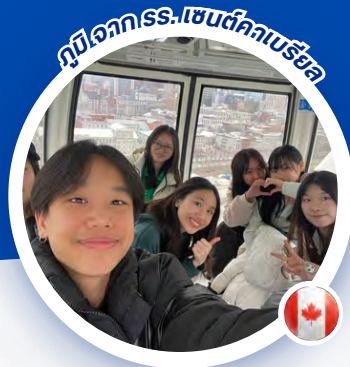
ณัฐจากรร. เซนต์คลาเรนซ์