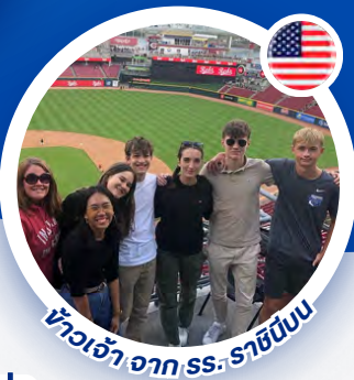
หัวเจ้า จาก รร. ราชินีบน